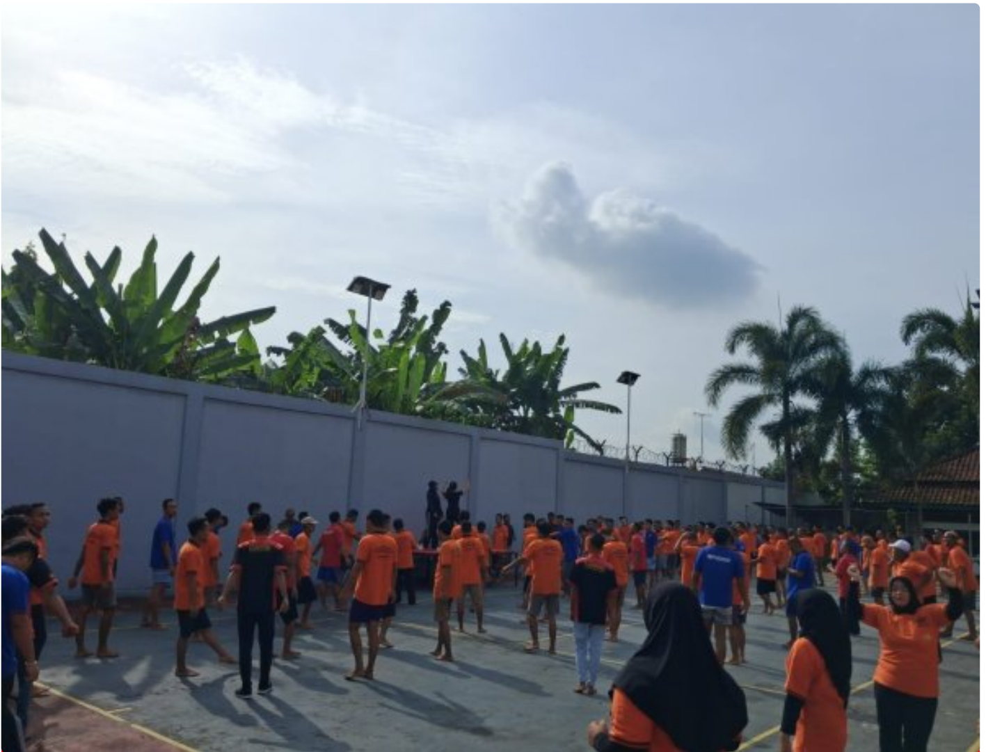
Senam pagi wbp rutan purbalingga

Purbalingga - Warga binaan Rutan Kelas IIB Purbalingga melaksanakan kegiatan senam bersama dipimpin oleh dua instruktur senam yang berlangsung dengan penuh semangat dan kebersamaan. Kegiatan ini didampingi langsung oleh pegawai rutan serta anak magang yang turut berperan aktif dalam mendampingi jalannya senam. Sabtu (13/12/25).